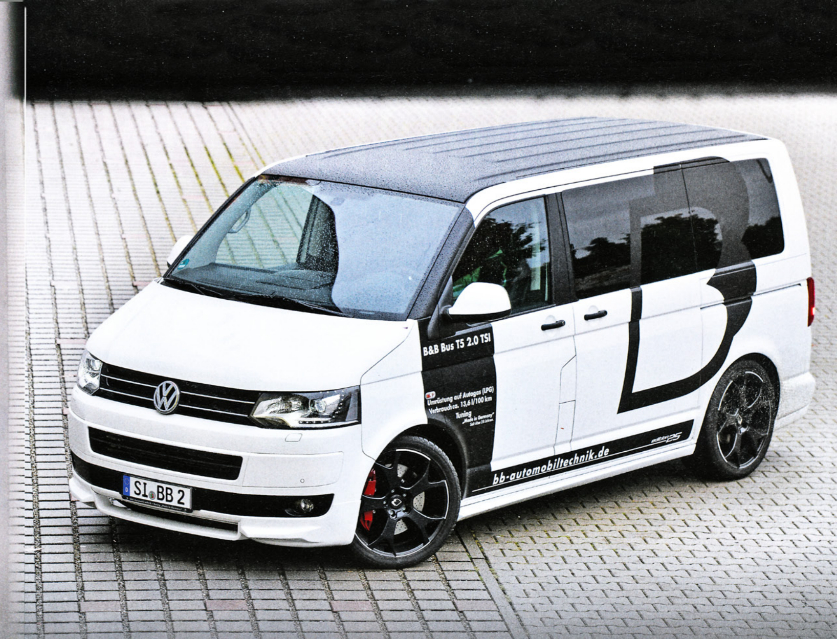
Sportwagen-Performance im 320 PS-Multivan bei Kraftstoffkosten unter Serienniveau – der B&B T5 ist ein Veredelungs-Konzept der Extraklasse

Lediglich das Auspuff-Dröhnen wollte nicht so recht zum überzeugenden Umbau passen. B&B hat den Dämpfer aber schon überarbeitet. Text ▶ Arne Olerth