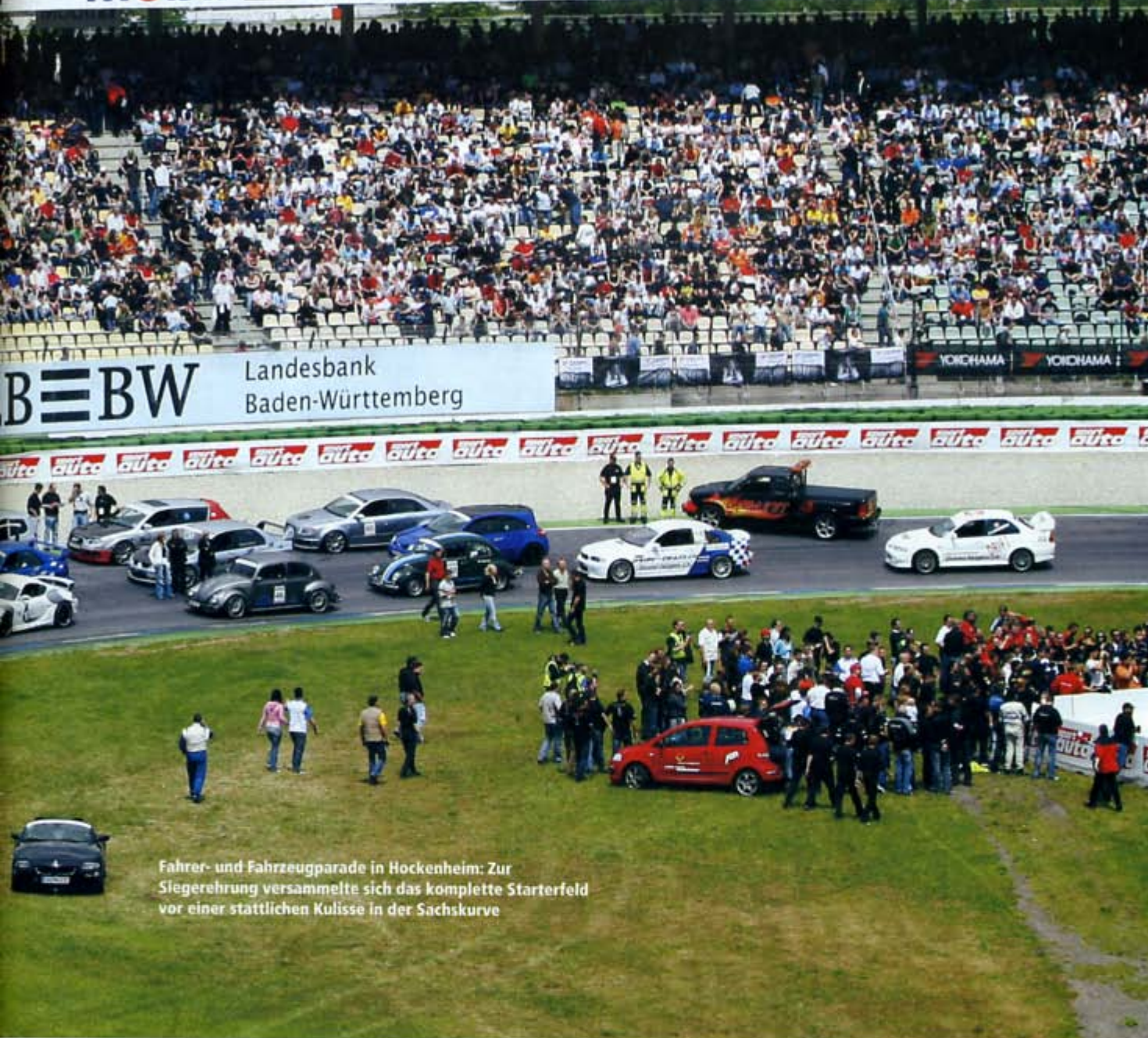
Fahrer- und Fahrzeugparade in Hockenheim: Zur Siegerehrung versammelte sich das komplette Starterfeld vor einer stattlichen Kulisse in der Sachskurve