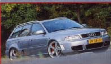
Der rasende Holländer: Eriks RS4 bringt es mit Tuning von B&B Automobiltechnik auf 308 km/h Spitzengeschwindigkeit

Sitz der Nebelleuchten fest eingeplant hatte, gähnen ungefüllte Löcher. Doch dies ist nicht etwa ein Schönheitsfehler, sondern nur ein weiterer Teil der ausgeklügelten Leistungsarchitektur. Denn durch das Entfernen der Nebelleuchten konnte