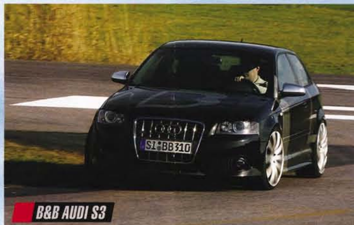
B&B AUDI S3