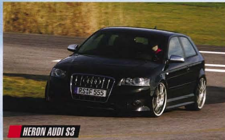
HERON AUDI S3