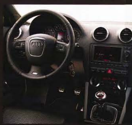
Die Schaltwegverkürzung des B&B S3 (im Bild) überzeugt. Tipp: Kaufen

de es eher zum Duell der Reifen – mit knappem Sieg für B&B. Der Dunlop SP Sport Maxx hat den moderneren Conti-Pneus nicht viel entgegensetzen. Ganz im Gegenteil. Der S3 verlangt damit deutlich mehr Aufmerksamkeit vom Fahrer, wechselt munter vom Unter- zum Übersteuern und bietet zudem weniger Grip. Bei 2:02,84 Minuten bleibt die Uhr nach einer Runde stehen. Wesentlich entspannter, aber mit 2:03,71 Minuten kaum langsamer, geht es im Heron um den 3,6 Kilometer langen Kurs. Selbst der Vorteil der größeren Bremsanlage nutzt dem