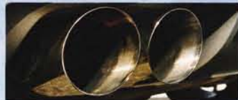
Der Sportauspuff aus Edelstahl ist teuer, aber ab Kat neu verlegt