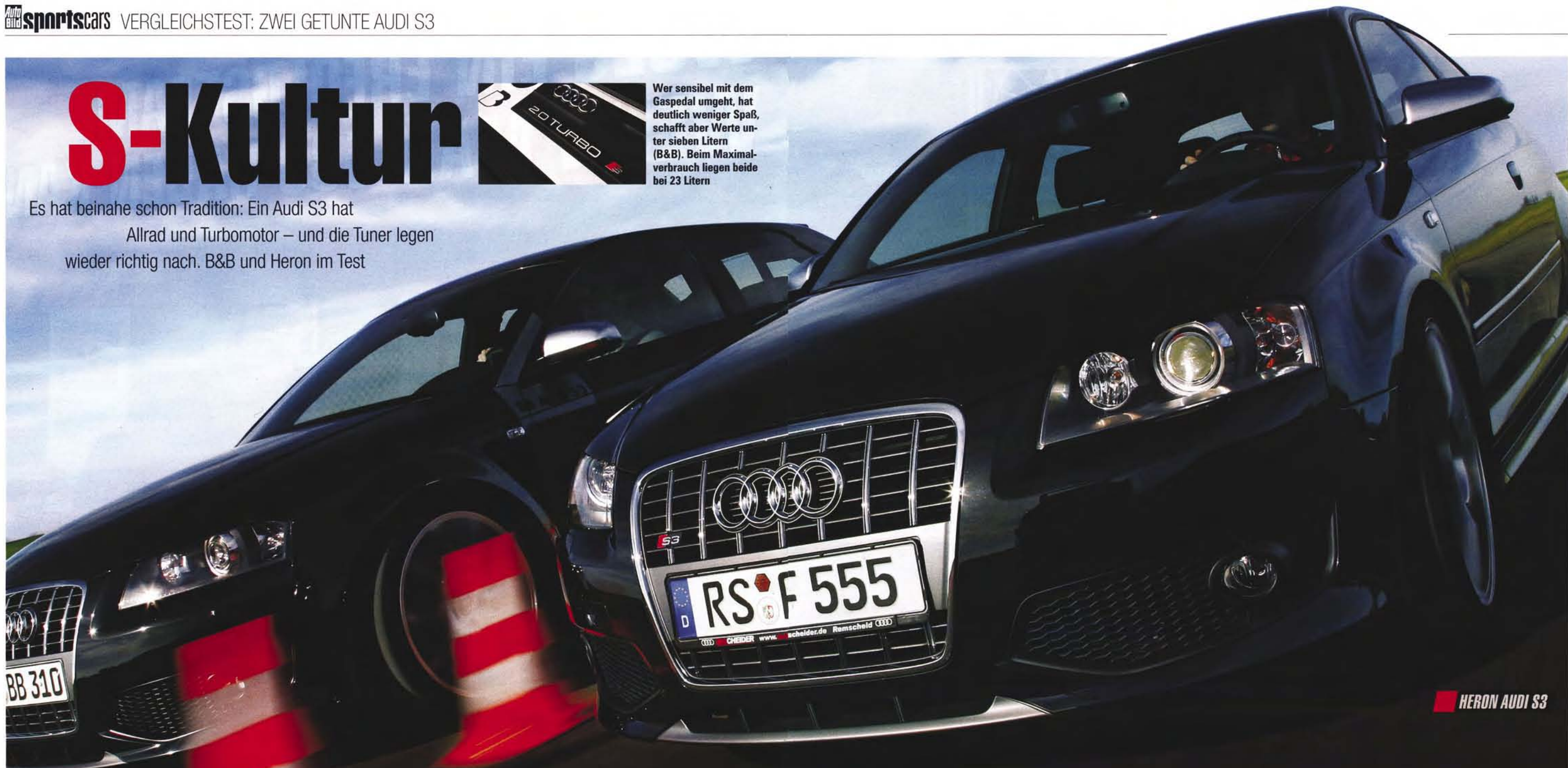
HERON AUDI S3

Es hat beinahe schon Tradition: Ein Audi S3 hat Allrad und Turbomotor – und die Tuner legen wieder richtig nach. B&B und Heron im Test