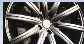
Das 19-Zoll-Rad sieht toll aus. Von der Dunlop-Bereifung raten wir ab