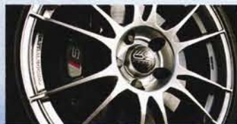
Das O.Z.-Rad ist bildschön, die Bremsanlage dahinter serienmäßig