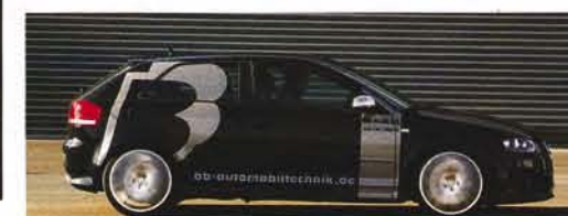
B&B Audi S3: Gewindefahrwerk, 30 Millimeter tiefer

der Elastizität, der Heron kommt an den B&B S3 einfach nicht heran. Mit 5,5 Sekunden bis Tempo 100, und 15,8 Sekunden bis 180 km/h, ledert das Siegener Exemplar den Heron gehörig ab. Mit 5,7 Sekunden von 0 auf 100 km/h liegt der zwar genau auf dem Niveau