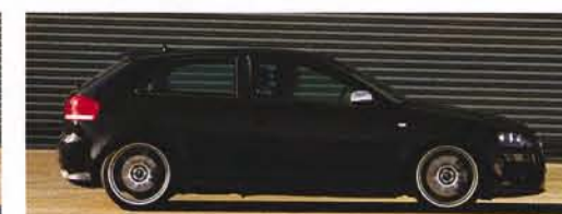
Heron Audi S3: KW-Gewindefahrwerk, 35 Millimeter tiefer