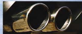
Endtopf mit Klappensystem und wirklich mörderischem Sound